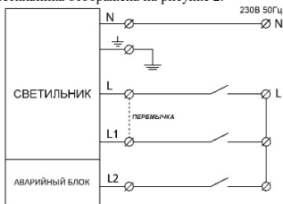
Рисунок 2 Схема подключения светильника

3.3 Схема подключения светильника отображена на рисунке 2.